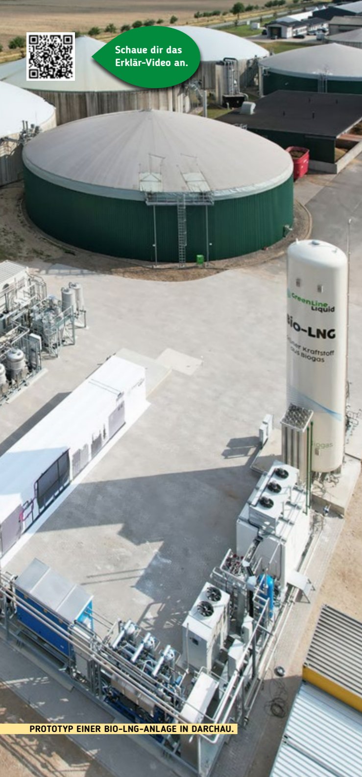
PROTOTYP EINER BIO-LNG-ANLAGE IN DARCHAU.