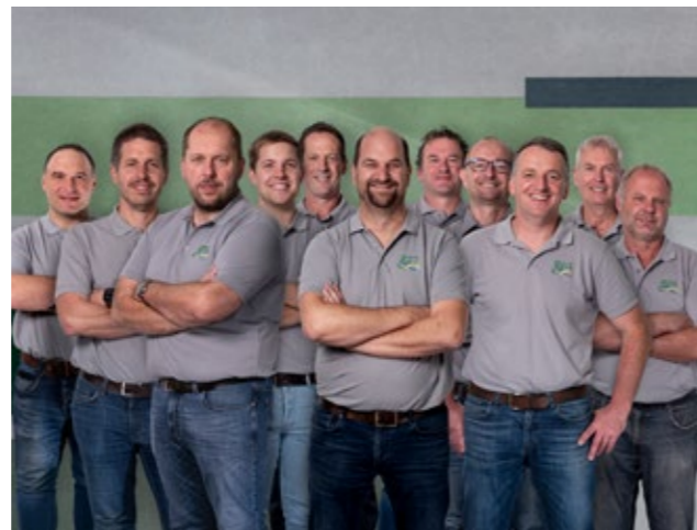
Konzept und Gestaltung: Anja Dorn, White & friends, Kempten

REG BioLNG GmbH Stadels 9 • 88179 Oberreute, Stadels www.reggmbh.de